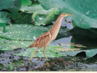
● 労災病院周辺で見られる鳥 ●

腹腔鏡下手術は確かに優れた術式で、今後益々、普及するものと思われます。しかし、歴史の浅い手術であることから、今後の経験や術後長期の経過を累積し検討していくことが必要であることは言うまでもありません。当科では、技術の向上や器具