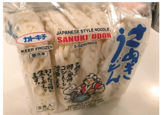
カトキチの冷凍うどん

ています。財田の道の手打ちうどんの講師をしている母親から手ほどきも受けました。でも残念ながら、麵棒はまだ封を切らずに新品のままです。