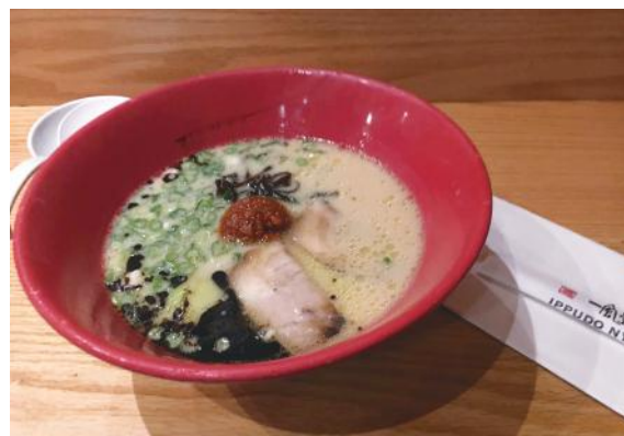
このラーメンが1700円余り

円ぐらいですが、こちらでは16ドル（約1760円）。倍以上です。それだけだと物足りないので、替え玉（2ドル）を頼み、チップを払うと、確実に20ドルになります。つまり約2200円。ラーメン一杯で2000円を超えるのです！