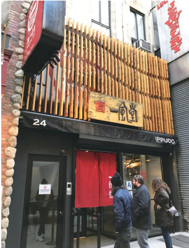
立派な店構えの一風堂ラーメン

せん。ハワイやロサンゼルスでは丸亀製麺が人気だと聞きますが、こちらには進出していません。先日、