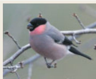
● 労災病院周辺で見られる鳥 ●

入院・外来を問わず、治療を受けられる方が大切にされていることを一緒に大切にしたい、少しでもその人らしく過ごせるようにチーム医療の一員として身体的・精神的にサポートしていきたいと考えています。抗がん剤治療でご相談がある場合は、病棟看護師または相談支援センターにお問い合わせ下さい。