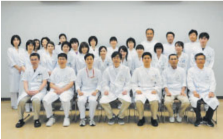
糖尿病関連検査の一つで