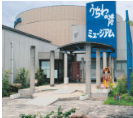
【うchwの港ミュージアム】丸亀市港町 日本一の丸亀うchw及び全国の主なうchwも 展示しているうchwの総合博物館

なプレート(金属の板)で固定する手術を行い、大腿骨近位部骨折では髓内釘というネジと棒を組み合わせたような器械で固定したり、人工骨頭に変える手術をしたりします。特に大腿骨近位部骨折では、寝たきりを作らないよう、ほとんどの場合で手術を行います。