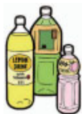
ソフトドリンクなどから果糖を摂りすぎると…「高脂肪食」を続けているような状態に…

肝臓で果糖はほとんど分解されて、その不必要なエネルギーは結果として中性脂肪やコレステロールの合成にまわされてしまうからです。脂質異常症を引き起