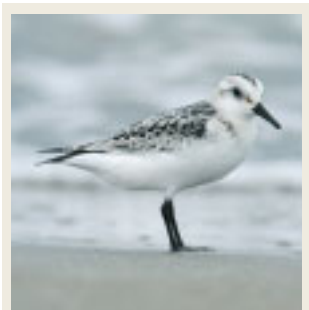
● 労災病院周辺で見られる鳥 ● ミュビシギ

7月から放射線科で勤務しています。生まれは大阪ですが、6歳以降は徳島、大学からは香川なので、人生のほとんどは四国で過ごしています。そろそろ香川歴が徳島歴を追い抜きそうです。趣味は読書と音楽鑑賞です。読書はミステリーが一番好きで