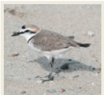
● 労災病院周辺で見られる鳥 ● シロチドリ

丸亀には妻の実家があり、なじみ深い土地です。リハビリテーションに大切な多職種との連携を深め、中讃地域の医療に貢献したいと思ひますし、皆様方のご協力