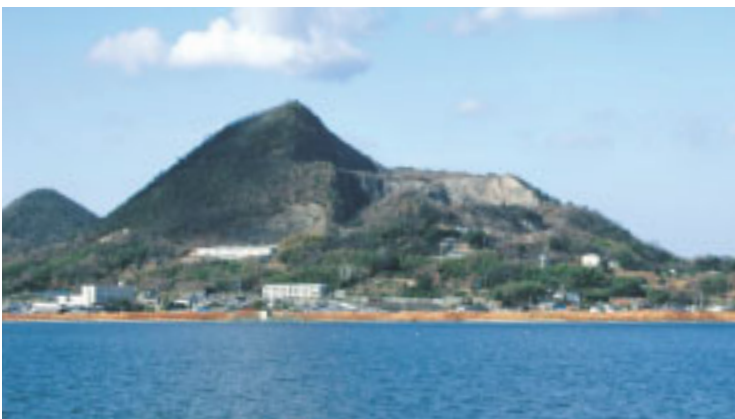
讃岐七富士の山 高瀬富士(爺神山) 三豊市 標高約214m