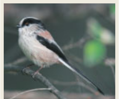
● 労災病院周辺で見られる鳥 ●

★米粉は「だま」にならない という特徴がある ホワイトソース、お好み焼 きなどの料理も美味しく仕 上がりやすい。いろいろなお 料理に試してみたいかが でしょうか。