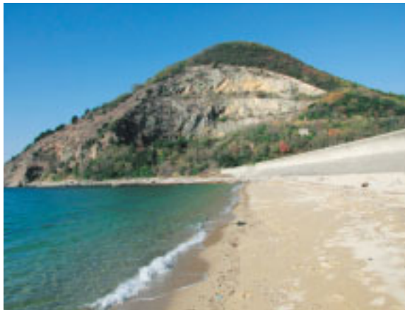
讃岐草原 (讃岐七富士のひとつ) 観音寺市有明浜 (標高153m)

近年では小切開での手術や内視鏡による患者様に優しい低侵襲な手術方法が発展してきており当院でも積極的に取り組んでいます。術後の痛みが軽く早期に歩行が可能で入院期間も1週間程度と短縮傾向にあります。 また、日常によく耳にする腰椎の疾患として、腰椎椎間板ヘルニアが挙げられます。これは、腰椎の椎間板に何らかの負担がかかり亀裂が入ることにより椎間板の内容組織である髄核が椎間板外に脱出し馬尾神経を直接圧迫する病態です。強い腰痛や下肢のしびれや神経痛を引き起こします。しかしながら、腰椎椎間板ヘルニアの多くは自然軽快する