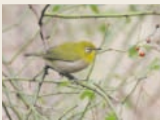
● 労災病院周辺で見られる鳥 ● メジロ

そんな感じで大きく予想と違ったピッカーですが、やって来て一ヶ月以上たった今では、なくてはならない存在になりました。確かに仕事は増えましたが、医療において一番大切な「安全」を保つ重要な相手なんです。特に休日。今まで一人で薬を出して一人で間違えがないか確認していた所を、まずピッカーが大体のものを手技ごとに取り揃えてくれる。その後に人が監査する。それは確実に今までの以上の安全に繋がっています。